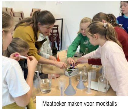
Maatbeker maken voor mocktails