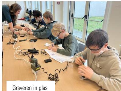
Graveren in glas